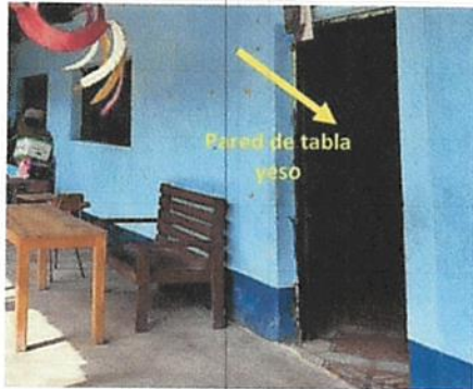
Foto1: División de aula con tabla yeso